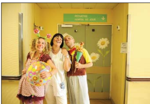
Là, nous sommes avec la chef de service qui a beaucoup oeuvré pour notre présence à l'hôpital

On essaiera de se préserver quelques bulles d'espace, entre deux chambres..